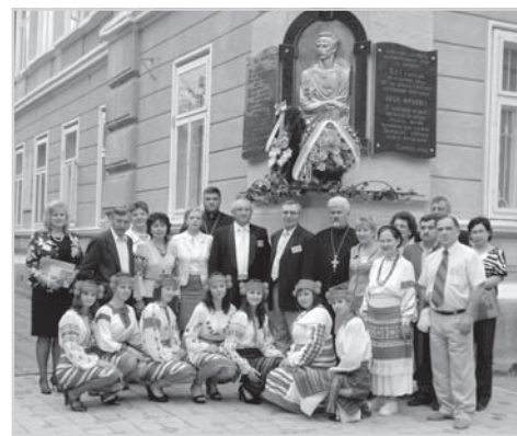
150 років Є. Озаркевичу. Медичний коледж ім. І. Франка, Коломия, 2011

Поважний науковець був бажаним гостем Ювілейної асамблеї «М'я на скрижалах української історії» з нагоди 150-ої річниці народження одного з засновників новітньої української медицини Євгена Озаркевича, що проходила в медичному коледжі імені